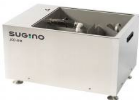
液中微細コンタミ・油分除去ユニット