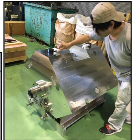
【組立】アルミ加工品+その他部品