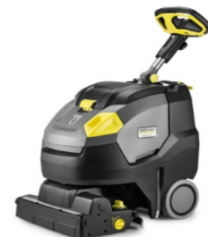
ケルヒャー クリーナー機器