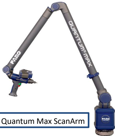
FARO Quantum Max ScanArm