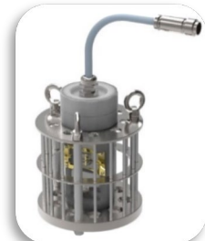
投げ込み式比重計