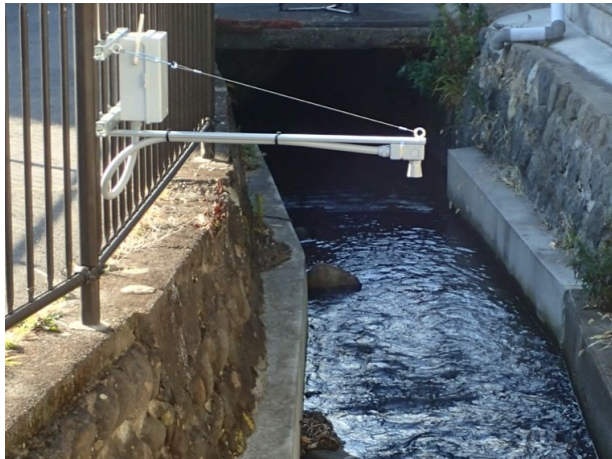
写真: 水位計設置例(長野県上田市)

本体重量は約1.1kg(電池・取付金具等除く)と軽量で、ガードレールやフェンスなどこれまで設置が難しかった場所にも設置が可能