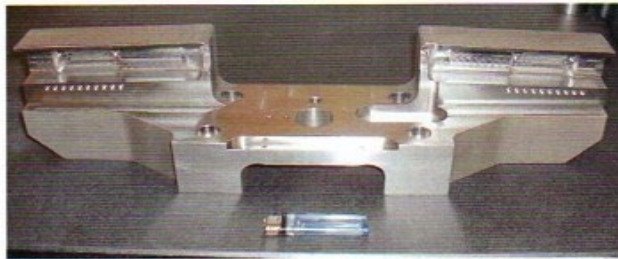
SUS630 140 x 150 x 520