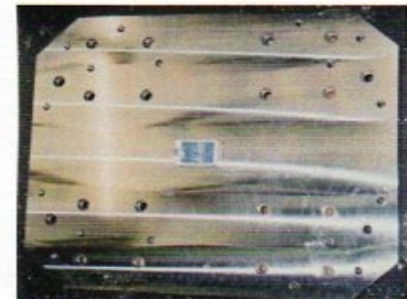
S45C 600 x 800