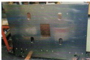
AL材 1000 x 1200