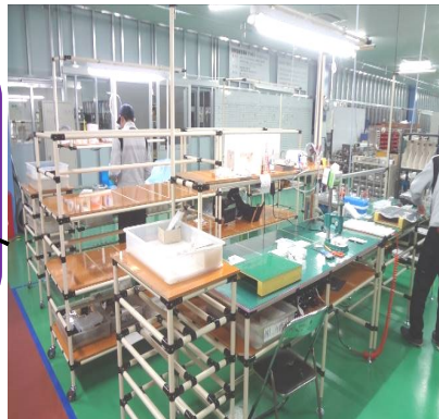
ユニット組立 ライン