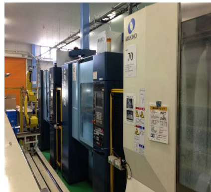
5軸マシニング センター + 自社開発ロボット 着脱システム