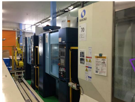
5軸マシニングセンター + 自社開発ロボット着脱システム