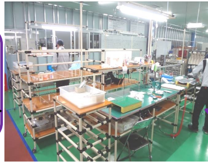
ユニット組立ライン