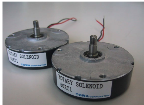
ロータリーソレノイド (自社開発・社内組立)