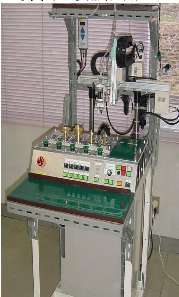
自動接着塗布機 (社内設計)