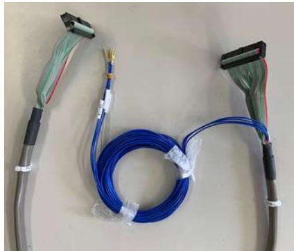
制御機器用ハーネス