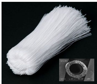
■当社コア技術: 中空糸