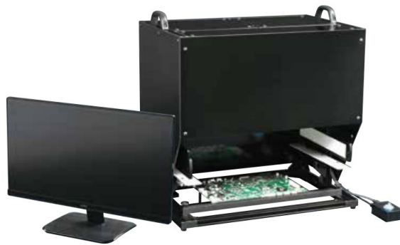
防湿剤塗布検査装置