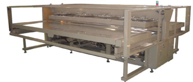
大型接着プレス機