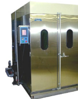
福祉用具洗浄乾燥機