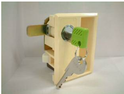
ロッカー用のラビットロックシリーズ