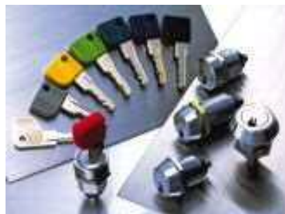
工業用ラビットロックシリーズ