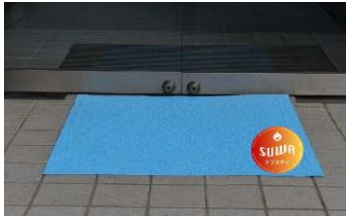
クリスティセイフティ