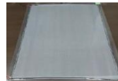
クリスティウォーマー