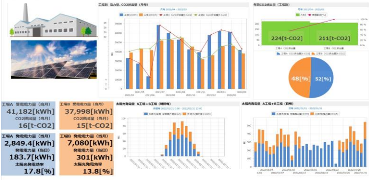
ダッシュボード画面例