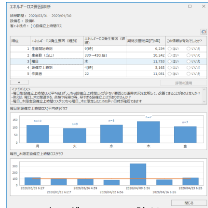
エネルギーロス要因診断画面例