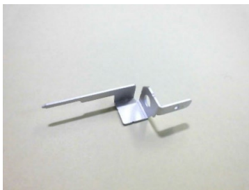
変形しやすい製品をバレル工法で処理