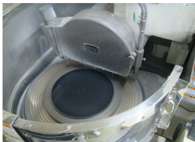
凹面形状の作り込みが可能なロータリ研削盤