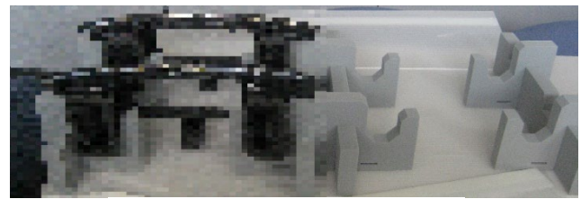
【大型部品輸送用固定具】 ※ほかし有