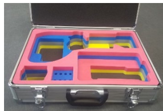
【工業製品用ケース】