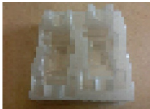
【真空成形トレイ】 ※ほかし有