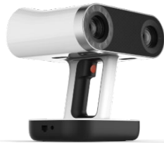
【3Dスキャナ】 Artec Leo