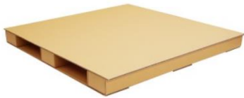
ワンコイン段パレ