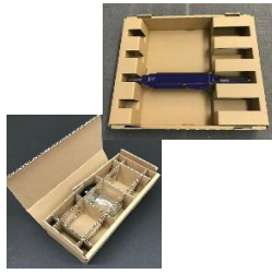
大型精密機器から小型製品まで