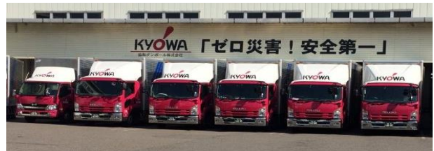
自社物流トラック