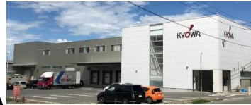
段ボール 衛生工場完備 防虫陽圧機