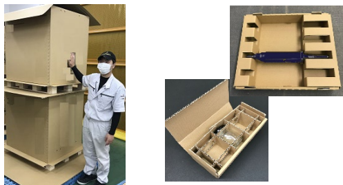
大型精密機器から小型製品まで