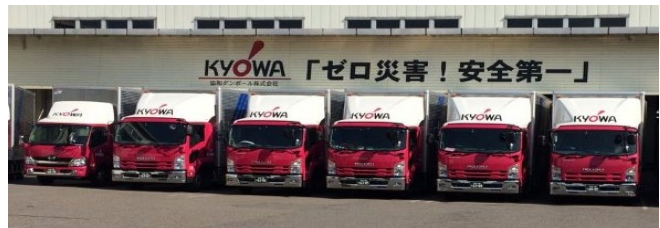
自社物流トラック