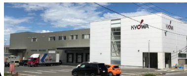
段ボール衛生工場完備 防虫陽圧機