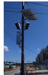
・全国初の太陽光発電による信号機