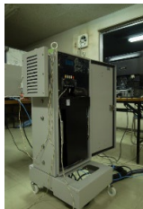
・3Kwhリチウムイオン電源システム