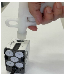
手術支援ロボットのインストゥルメントや耳鼻科吸引管の洗浄ノズルを新発売!!