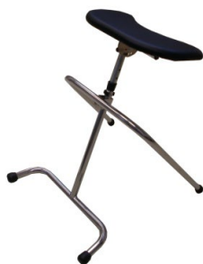
姿勢補助手すり 楽助さんⅡ