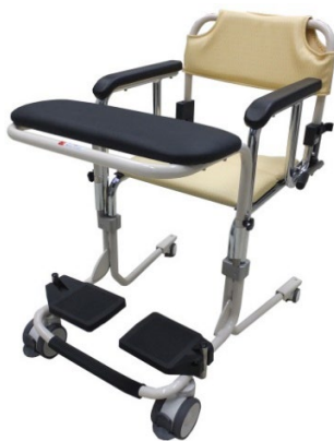
らくらく移乗車いす 乗助さんⅡ