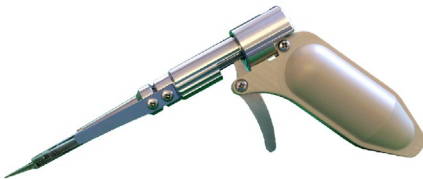
■信州大学医学部と共同開発

開発事例1(術具) 【マイクロサージャリー用 グリップ型持針器 Type-MY】