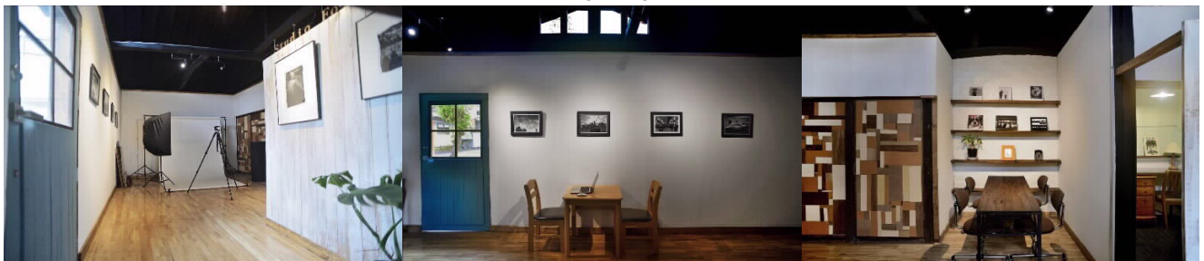
築約100年の古民家をセルフリノベーションした弊社スタジオは、環境に配慮したサステナビリティな第3世代の撮影スタジオです。土壁や梁を生かしたスタジオは古くて新しい弊社独自開発の空間デザインです。2019年7月、下諏訪町にオープンしました！