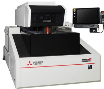
ワイヤーカット ミツビシ MV1200R