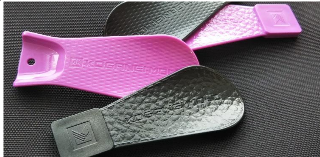
「デジタルシボ」を施した当社のオリジナル「シューホーン」

「デジタルシボ」開発用に有機的なデザ インが得意な「仮想クレイモデラー」を導 入し、機械系CADとの融合を図る