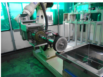
研磨ロボット(バフ研磨中)