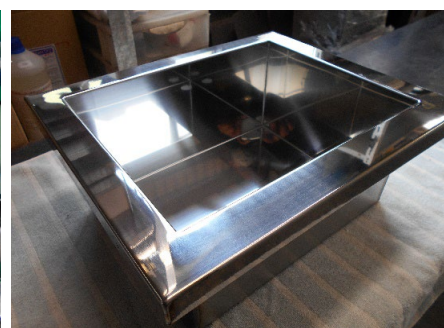
ロボットによる溶接・研磨仕上げ (酸洗い済み品)