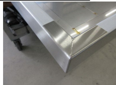
SUS HL 仕上げ