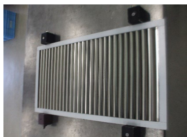
SUS 1.2t HL 医療装置パネルガリ