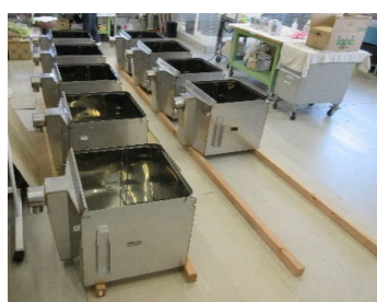
SUS316 1.0t 洗浄タンク