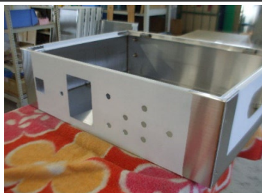
SUS 1.5t HL 配電ボックス