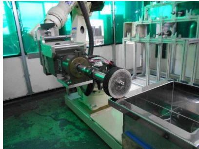
研磨ロボット(バフ研磨中)