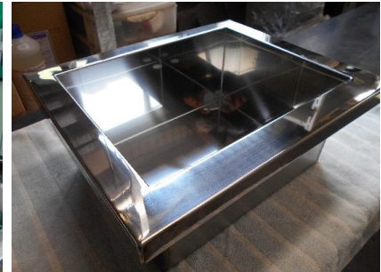
ロボットによる溶接・研磨仕上げ (酸洗い済み品)