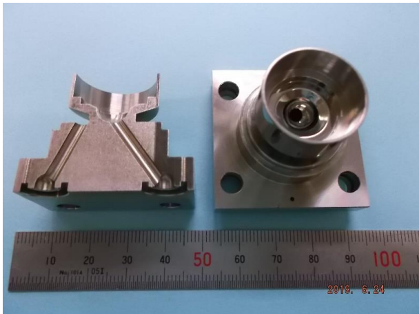
材質: SUS316L-P 球面斜め穴加工 公差0.02