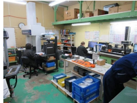
<検査工程:三次元測定機を用いて対応> 要望により詳細までの測定や成績書の提出可