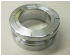
アルミ系 自動車部品