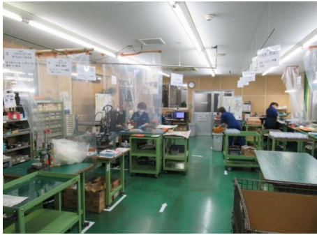
<材料調達～全加工～一部組立まで>