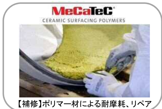
【補修】ポリマー材による耐摩耗、リペア