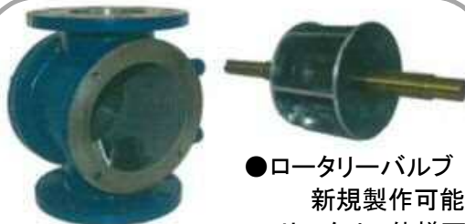
●ロータリーバルブ 新規製作可能 サニタリー仕様可

【予防保全・補修】 新品のロータリーバルブの内面に超硬溶射 ローター羽根への耐摩耗 溶接肉盛り