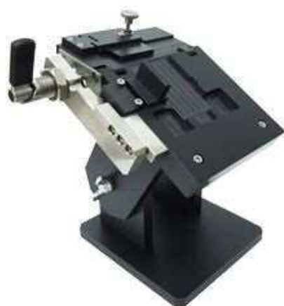
<治工具設計製作例> (コネクタ組立治具)