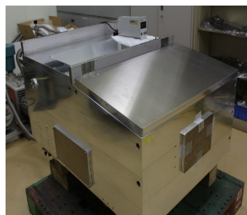
アルミ溶接チャンバ