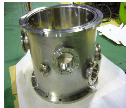
丸形真空チャンバ