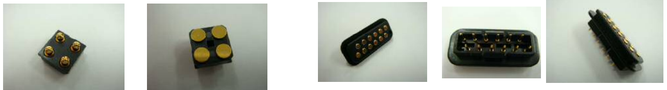
防水コネクタ部品