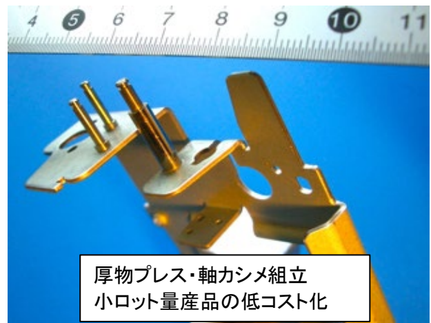
厚物プレス・軸カシメ組立 小ロット量産品の低コスト化