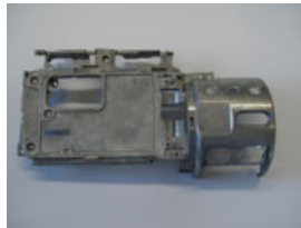
デジタルビデオカメラ 材質 AZ91