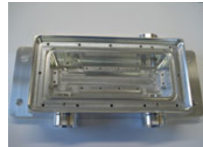
船舶用無線機 材質A5052