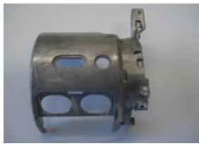
デジタルビデオカメラ 材質AZ91

小ロットから試作品、大量生産品と幅広くニーズにお応えし、高品質管理のもと製作をしています