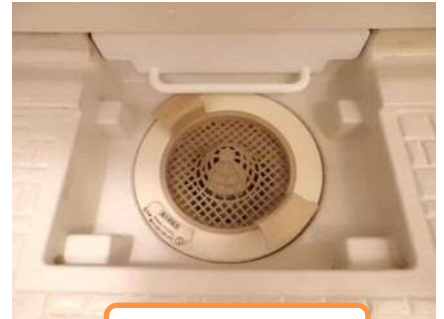
ヌメリ・カビを排除