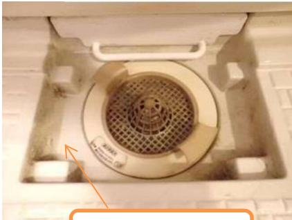
ピンクヌメリ・カビ