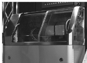
▲素材感を活かした美しいデザイナーズカバー。

装置の形状や使用方法に合わせてオーダーメイドで製作。 デザインと機能で製品の販売力(魅力・付加価値など)アップ。