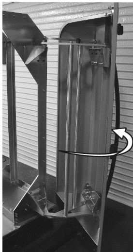
▲省スペース開閉を実現し、少しの力で開くリンクアーム扉。