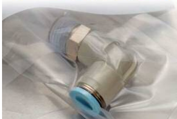
チューブフィッティング