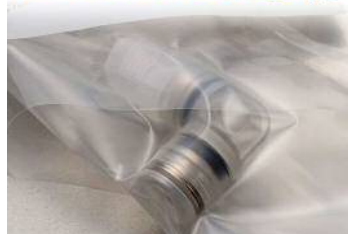
チューブフィッティングPPタイプ