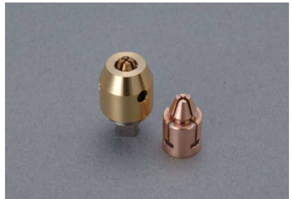
非磁性のチャックユニット