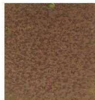
脱脂の後、8か月間の大気暴露