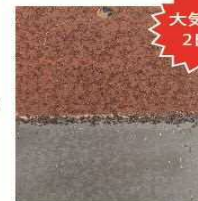
遮へい大気による暴露