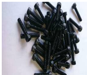
クロムモリブデン鋼