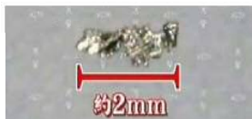
塗料から見つかった金属片