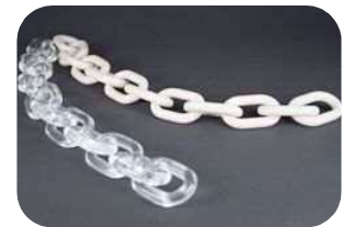
チェーン 角材から加工している為 継ぎ目がありません