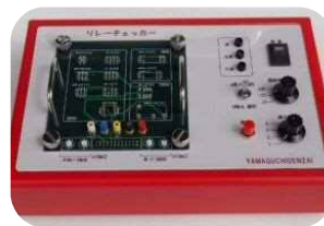
リレーチェッカー リレーの動作及び接点抵抗を チェックし良否判定をします