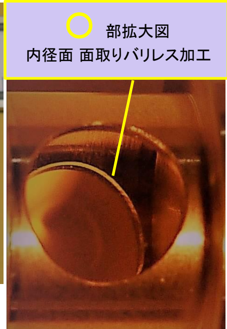
部拡大図 内径面 面取りバリレス加工