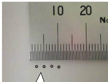
小径樹脂ワッシャーサンプル